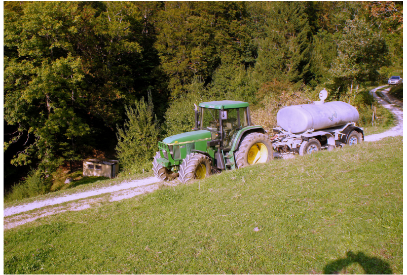
Das Gespann mit dem Zisternenanhänger beim Vorreservoir (links) im Graben zwischen der Ulmet und dem Bogental. Der Zisternenanhänger fasst 6 m 3 Wasser. Der Transport von 36 m 3 dauert 7 Stunden. Diese Menge reicht nur für einige Tage.